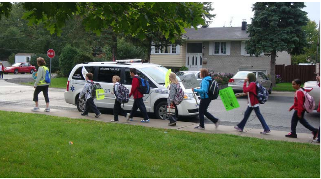
Un Pédibus est un parcours pédestre où les enfants sont accompagnés d'un conducteur bénévole pour se rendre à l'école.