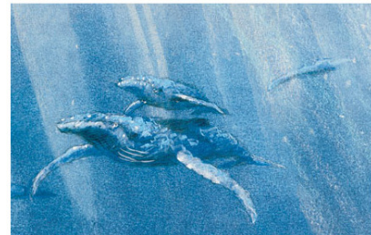
Image tirée du film Le fleuve aux grandes eaux de Frédéric Back