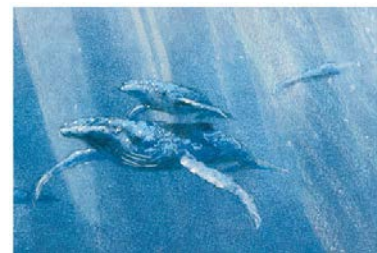
Image tirée du film Le fleuve aux grandes eaux de Frédéric Back

Dans une optique de sensibilisation, l'Éco-quartier propose la projection de documentaires traitant de diverses problématiques environnementales, telles que la déforestation, l'industrie agroalimentaire et les changements climatiques. L'écoute du documentaire est suivie d'une période d'échange sur la problématique en question. Étant donné que la plupart des documentaires ont une durée dépassant les 60 minutes, l'Éco-quartier peut écourter le visionnement en sélectionnant les passages